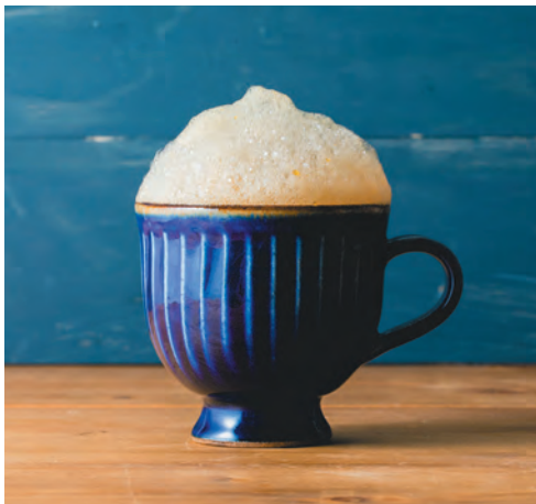
* ブクブク珈琲 (ホット・アイス)