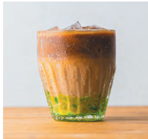
* かふうオリジナルブレンド カフェラテ (アイス)

最強アンチエイジングドリンクの バタフライピーティーと ココナッツミルクを使ったラテ ココナッツの中に 優しい豆の味を感じて頂けるように仕上げました