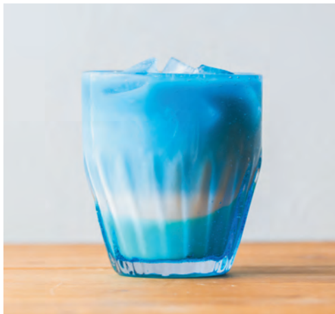
* かふうブルーラテ (アイス)

ハイビスカスティーのすっきりとした酸味を 北海道豊富町のミルクでまろやかに ほっと優しい風味に仕上げたラテです