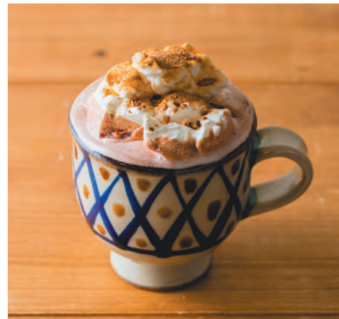
はてるまじま * 波照間島の黒糖ココア (ホット)

沖縄県・読谷村産の紅イモを たっぷり使った《紅イモ感》強めの飲み心地 舌触りでも紅芋の素材感を 感じて頂ける食感に仕上げています