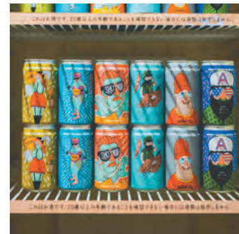
沖縄クラフトビール