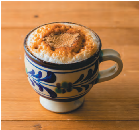
はてるまじま * 波照間島の黒糖ラテ (ホット)

琉球王朝時代から伝統のある 沖縄のブクブク茶を 珈琲にアレンジしました。 見た目やふわふわの感触とともに 味わってください