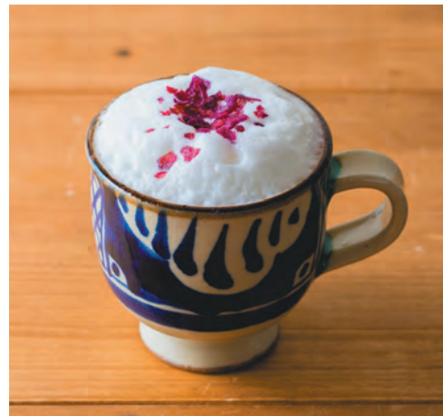
よみたんそん * 読谷村の紅イモラテ (ホット)

エスプレッソマシンで淹れた 深く濃厚なカフェラテと 波照間島産黒糖のkok深い甘さを たっぷり味わえる 大人のラテです