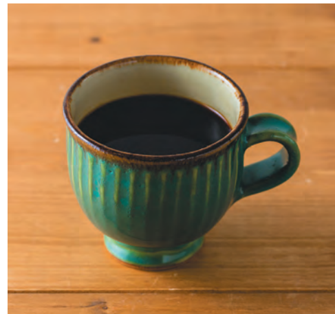
* 沖縄コーヒー (ホット)