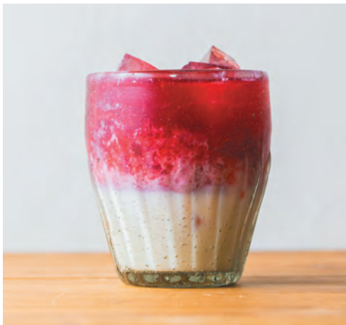
* かふうピンクラテ (アイス)